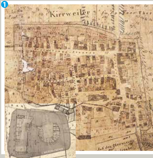
Verortung des Schlosses im Urkataster von 1851

In der zweiten Phase im Spätbarock (18. Jahrhundert) ❻ erhielt die Hauptburg nach umfangreichen Baumaßnahmen einen direkten Zugang zum Ortskern. Auf der Wirtschaftsinsel entstanden unter anderem die Schaffnerei – heute „Schlüssel“ genannt – und die große Kellerei.