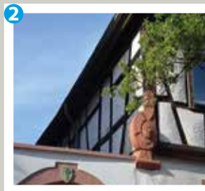
Ein Fachwerkhäuser in der Hauptstraße zeigt noch original Voluten als steinernes Zeugnis des verlorenen Wasserschlosses zu Kirrweiler.