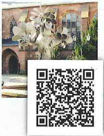
Der Baum des Lebens