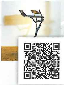
Wein-Stock und Bibel