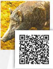
Der Eber wühlt ihn um