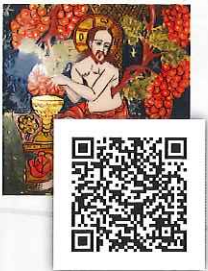
Jesus der Weinstock