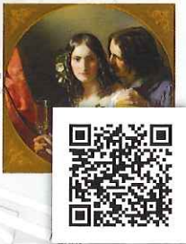
Wein und Liebe